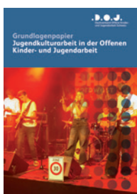
Grundlagenpapier Jugendkulturarbeit in der Offenen Kinder- und Jugendarbeit