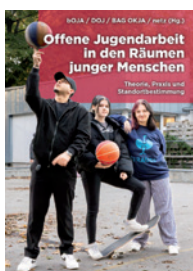
Sammelband Offene Jugendarbeit in den Räumen junger Menschen (Mitherausgeberschaft)