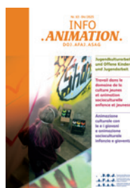
Fachzeitschrift InfoAnimation: Nr. 63 zu Jugendkulturarbeit und OKJA . Nr. 64 zu Rahmenbedingungen in der OKJA . Nr. 65 zu Mobilität in der OKJA