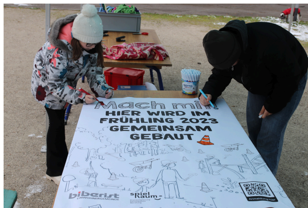
Informationsveranstaltung in Biberist, während eines Zeitraums mit geringer Partizipation. Ein Plakat wurde gemalt, um die nächste Mitmachaktion anzukündigen: die Mitmachbaustelle. Biberist, Dezember 2022

Während der Ausschreibung passiert normalerweise gegen aussen nicht viel. Mit kleinen Anlässen können Beteiligte immer wieder über den aktuellen Stand informiert werden. Dies kann z. B. in Form von Plakaten vor Ort, Medienmitteilungen, Videobotschaften oder ähnlichem passieren.